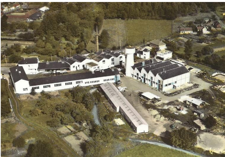
Vue aérienne de l'usine Yoplait.