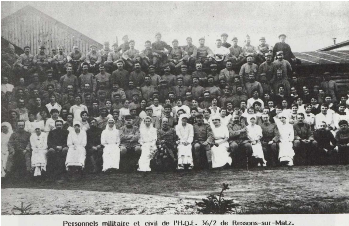
Personnels militaire et civil de l'H.O.E. 36/2 de Resson-sur-Matz.

Après-guerre, cet hôpital appelé par les locaux "le village des planches" servira de logement pour les réfugiés de Resson-sur-Matz, le temps de la reconstruction.