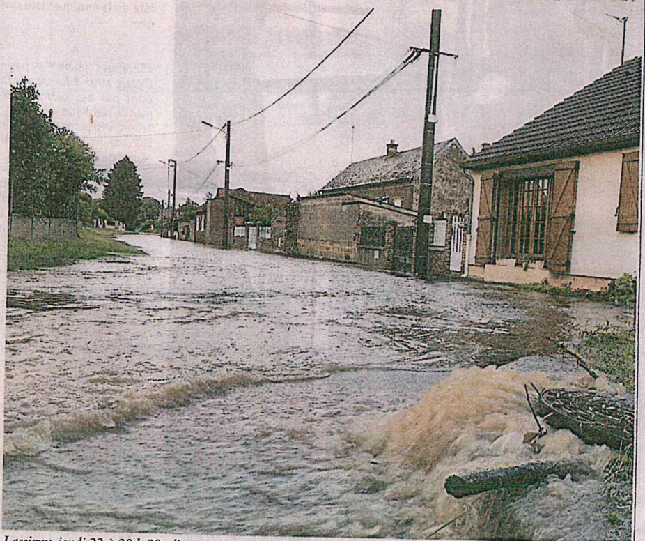
Lassigny, jeudi 23 à 20 h 30 : l'orage s'est achevé, les bouches d'égout continuent de refouler le trop plein d'eau dans une rue transformée en petit cours d'eau.